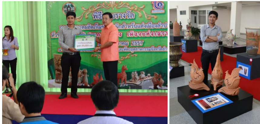
2.รางวัลดีเด่น การประกวดผลิตภัณฑ์เซรามิกสำหรับตกแต่งเมืองลำปาง