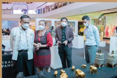
งานด้านการเผยแพร่