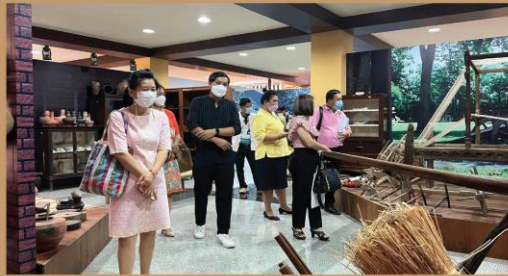
หออัตลักษณ์ลำปาง ณ สำนักศิลปะและวัฒนธรรม