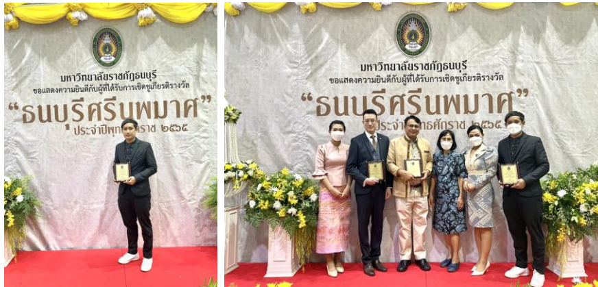
1.รางวัล “อนันต์ศรีนพมาศ” สาขาหัตถกรรมและคหกรรม ด้านเครื่องดิน