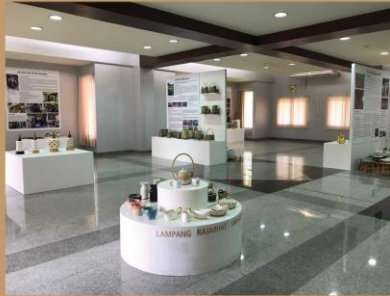
จัดตั้งศูนย์ช่างศิลป์และวัฒนธรรมล้านนาลำปาง - ลำพูน